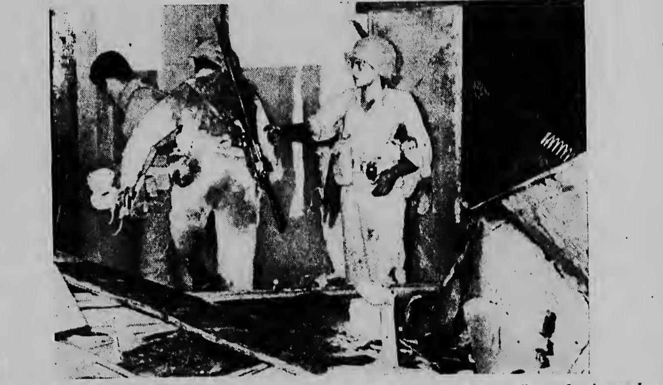
E foto oficial aki Israeli ta muestra un di e incidentenan cual tabata motibo di e kehonan di tanto Israel como Jordania dilanti di Naciones Unidas. E foto ta muestra soldadnan Israeli den un estacion di polles di Jordania na Kalkiyeh na momento cu nan tabata preparando un explosion. Esaki tabata parti di un atake di represalia y despues cu ela termina shete ora mas tardi, tabatin 43 morto y 25 herida.